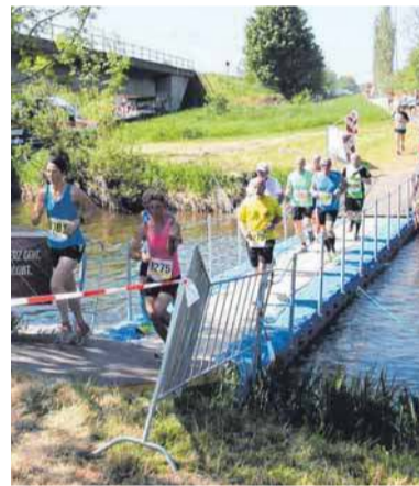
Die Extra-Brücke für run & fun wird in Möhringen aufgebaut.

nummer mit einem QR-Code versehen. Wer diesen Code mit dem Smartphone abscannt, kann Sekunden nachdem er die Ziellinie überquert hat, seine Laufzeit einsehen. Allerdings die Bruttozeit – heißt: Wer zum Beispiel beim Zehn-Kilometer-Lauf erst ein paar Sekunden