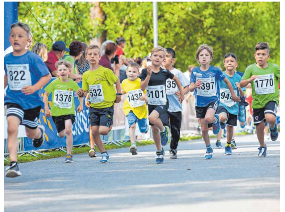
Beim Badenova-Fun-Cup geht's um den Spaß am Sport.

Donaustadion 08:00 Uhr Aesculap Donautal-Marathon 08:15 Uhr Sparkassen Staffellauf 08:25 Uhr Hettich Firmenlauf 21 Kilometer 08:35 Uhr Hammerwerk Fridingen Walking-Wettbewerb 09:25 Uhr Aesculap Halbmarathon