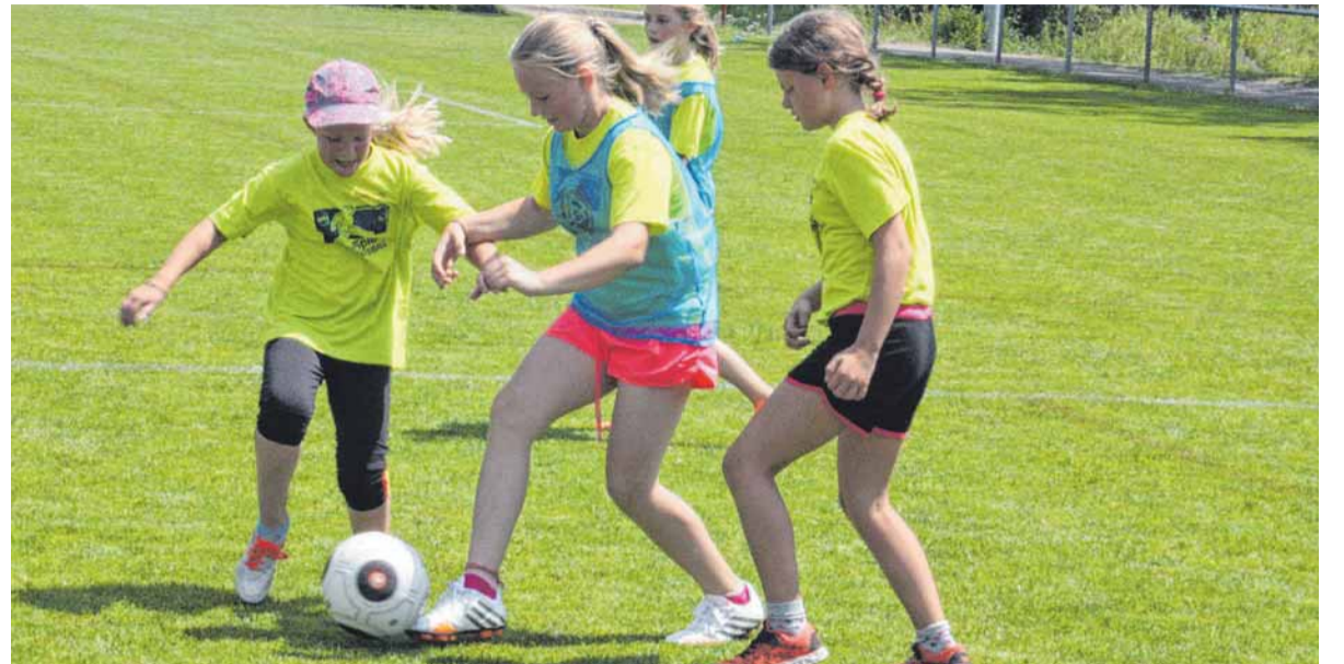
Beim „Vier gegen Vier“-Turnier bestand für die Spielerinnen die Möglichkeit, sich beim Tag des Mädchenfußballs richtig auszutoben.

So wurde der Tag des Mädchenfußballs eigens nach Tuttlingen gegeben, weil dort innerhalb von Jugendturnieren ohnehin viele Kinder vor Ort sind. Immerhin fanden sich