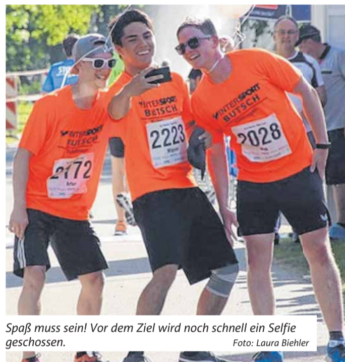
Spaß muss sein! Vor dem Ziel wird noch schnell ein Selfie geschossen.

Abseits von den Wettkämpfen gibt es auch ein spannendes Rahmenprogramm. Neben den vielen Ständen auf dem Gelände spielt am Samstagabend die Partyband Prof. Alban & die Heimleuchter . Los geht es um 20 Uhr auf der großen Bühne auf dem Festplatz.