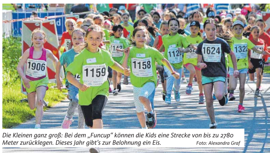
Die Kleinen ganz groß: Bei dem „Funcup“ können die Kids eine Strecke von bis zu 2780 Meter zurücklegen. Dieses Jahr gibt's zur Belohnung ein Eis.